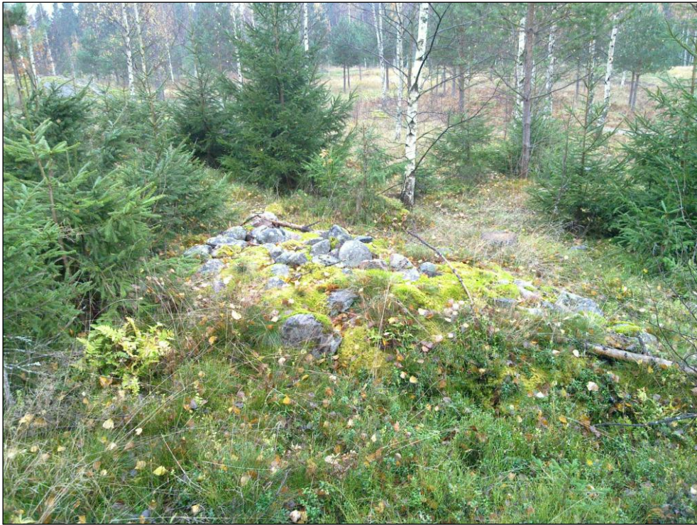
Erillinen rökkiö rökkiöryhmän ja maanottoaikan länsipuolella