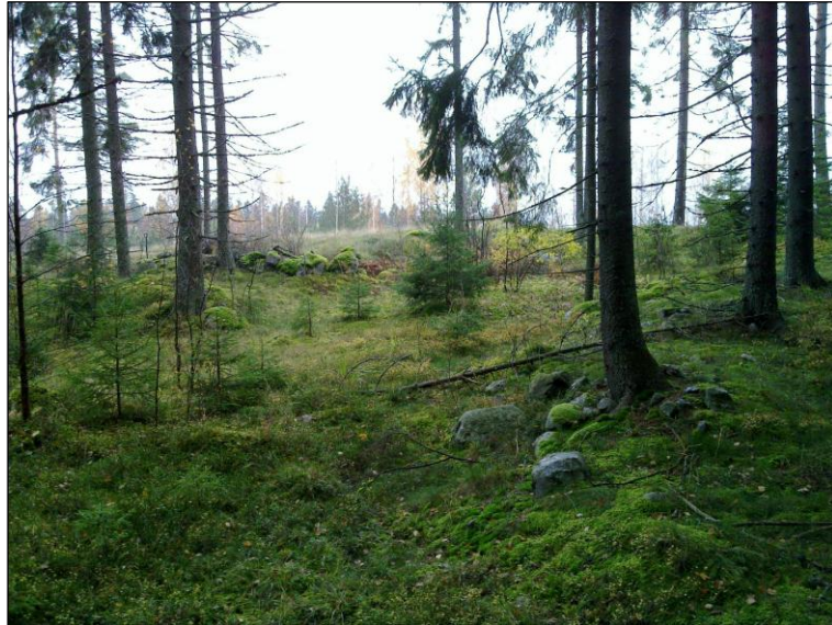
Länteen röykkiöryhmän länsipuolelta. Alla yläkuvan taustalla vas. raivatun alueen reunalla oleva kivikko