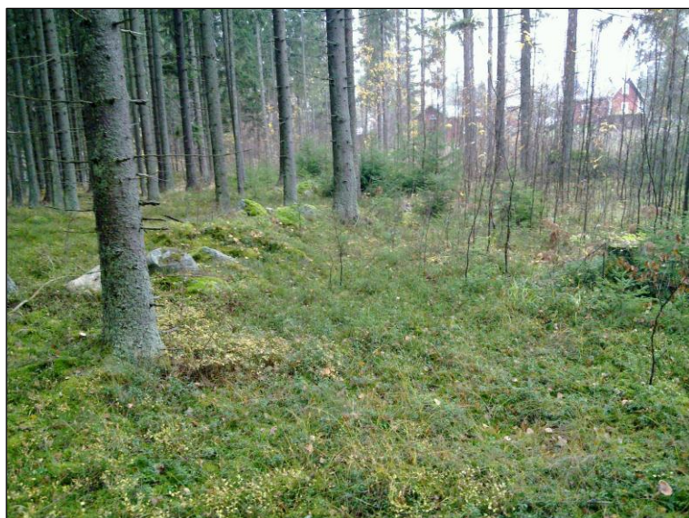
Raivatun ja oletetun maanottoalueen itäreunaa röykkiöalueen kupeessa