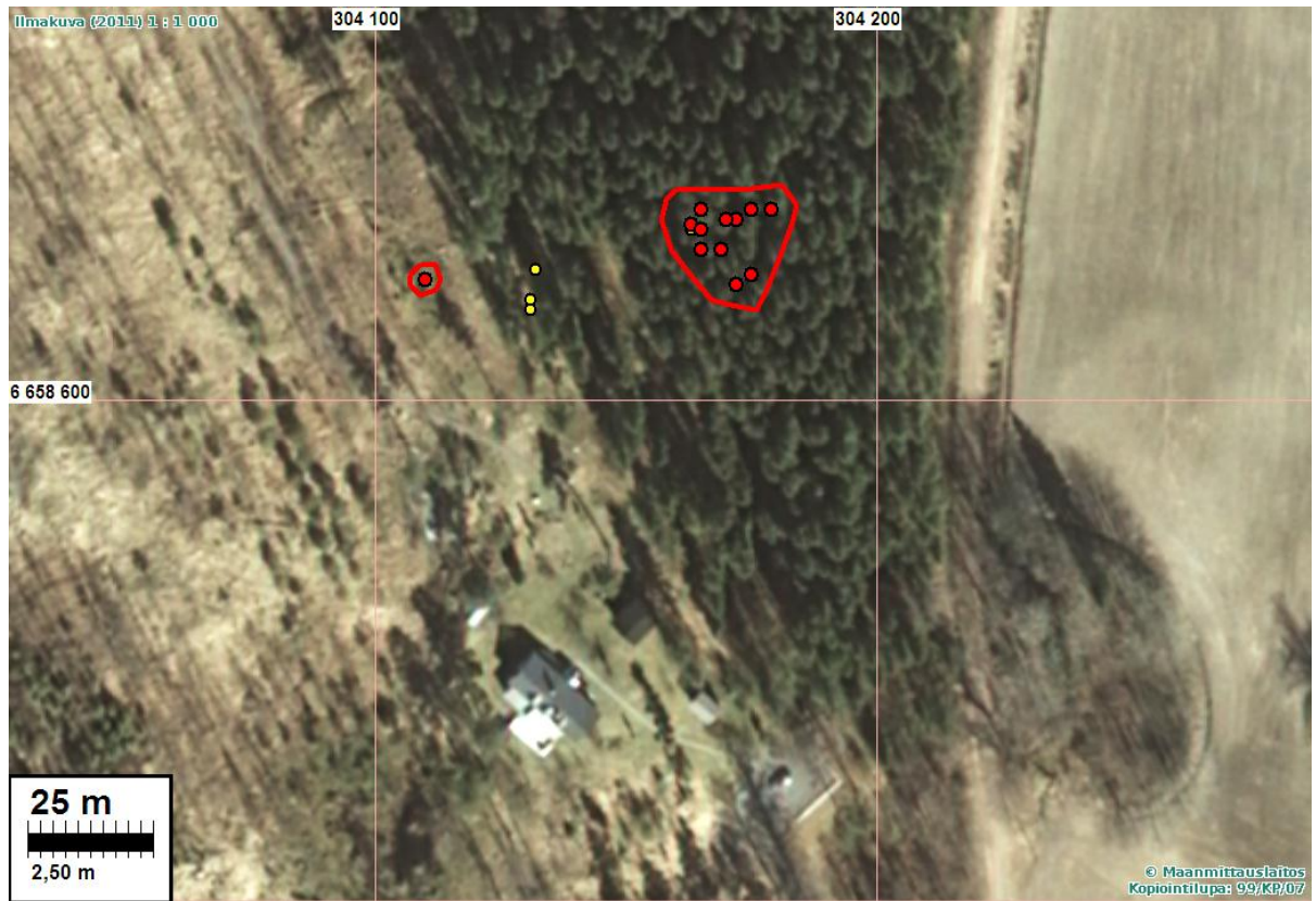
Röykkiöt pun. pallo, muinaisjäänönsrajaus punaisella. Maanoton raivauskivikko kelt.